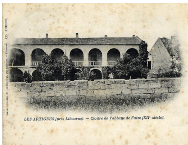
LES ARTIGUES (près Libourne). - Cloître de l'abbaye de Faize (XII e siècle).

A partir de la fin du Moyen Âge, l'abbaye tombe sous le régime de la commende : elle est dirigée par un abbé qui n'est plus un moine, mais une personne extérieure à l'abbaye, et qui en tire à lui le revenu (4500 livres en 1764).