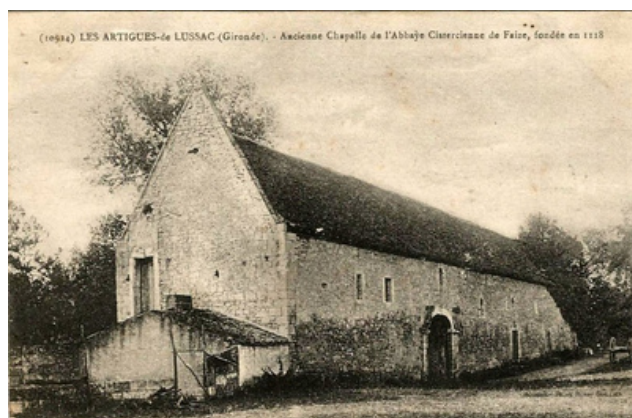
(10814) LES ARTIGUES-DE LUSSAC (Gironde). - Ancienne Chapelle de l'Abbaye Cistercienne de Faize, fondée en 1137

La résidence particulière des abbés de Faize était le Château Latour Ségur à Lussac, domaine appartenant à l'abbaye, construit au XIII e siècle et réaménagé au XVIII e siècle.