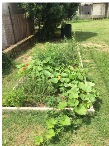
Jardin potager et composteur

La journée internationale de la forêt est un projet d'éducation au développement durable. Tous les enfants de l'école y ont participé au travers d'un projet pédagogique intitulé « la forêt s'invite à l'école ».