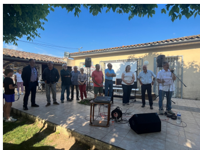
Elus du territoire et présidents du club

Le club est à l'origine, en partenariat avec le collège, d'une section tennis créée l'an dernier. Il s'investit également auprès des plus jeunes en proposant des initiations au cœur des écoles du secteur.