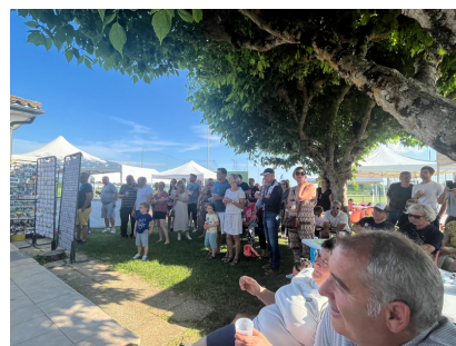
Les participants à la fête