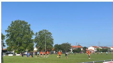
Tournoi de foot