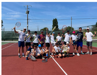
La section tennis