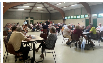
Concours de belote