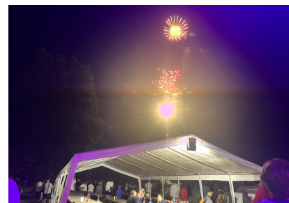
Marché gourmand & feu d'artifice

Nouveau cette année: un marché gourmand s'est installé pendant deux soirées grâce à l'implication de la Banda Les Lézards qui a également tenu la buvette sur la fête pendant tout le week-end.