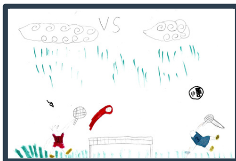
Illustration de Kenzo